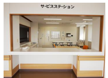
サービスステーション