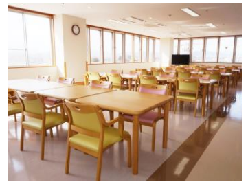
食堂兼機能訓練室